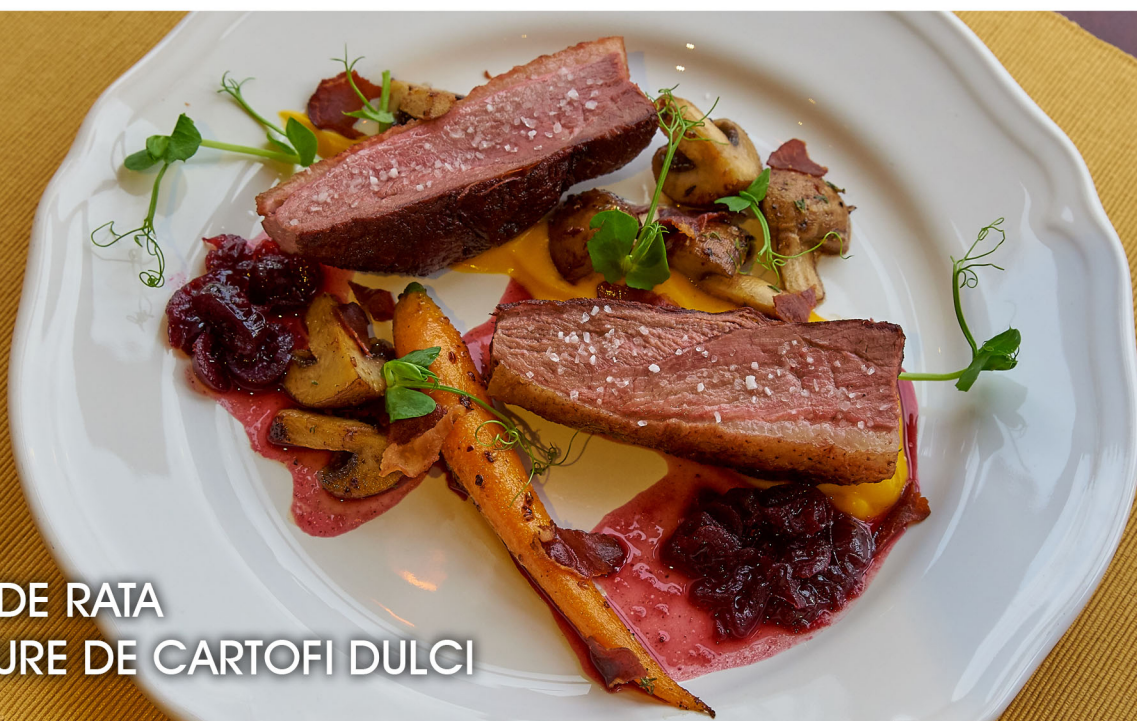
PIEPT DE RATA CU PIURE DE CARTOFI DULCI